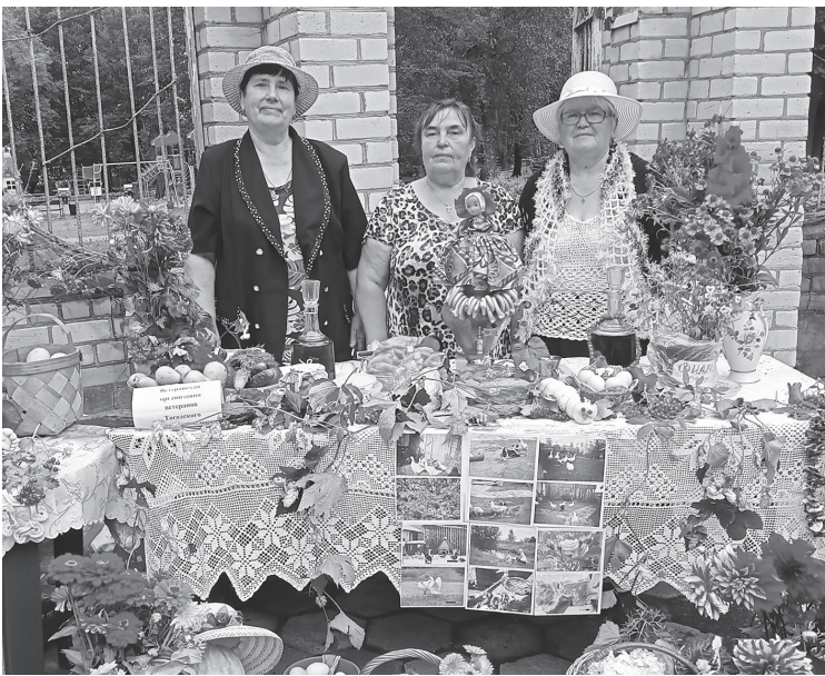
• Представители ветеранской организации Тогодского сельского поселения